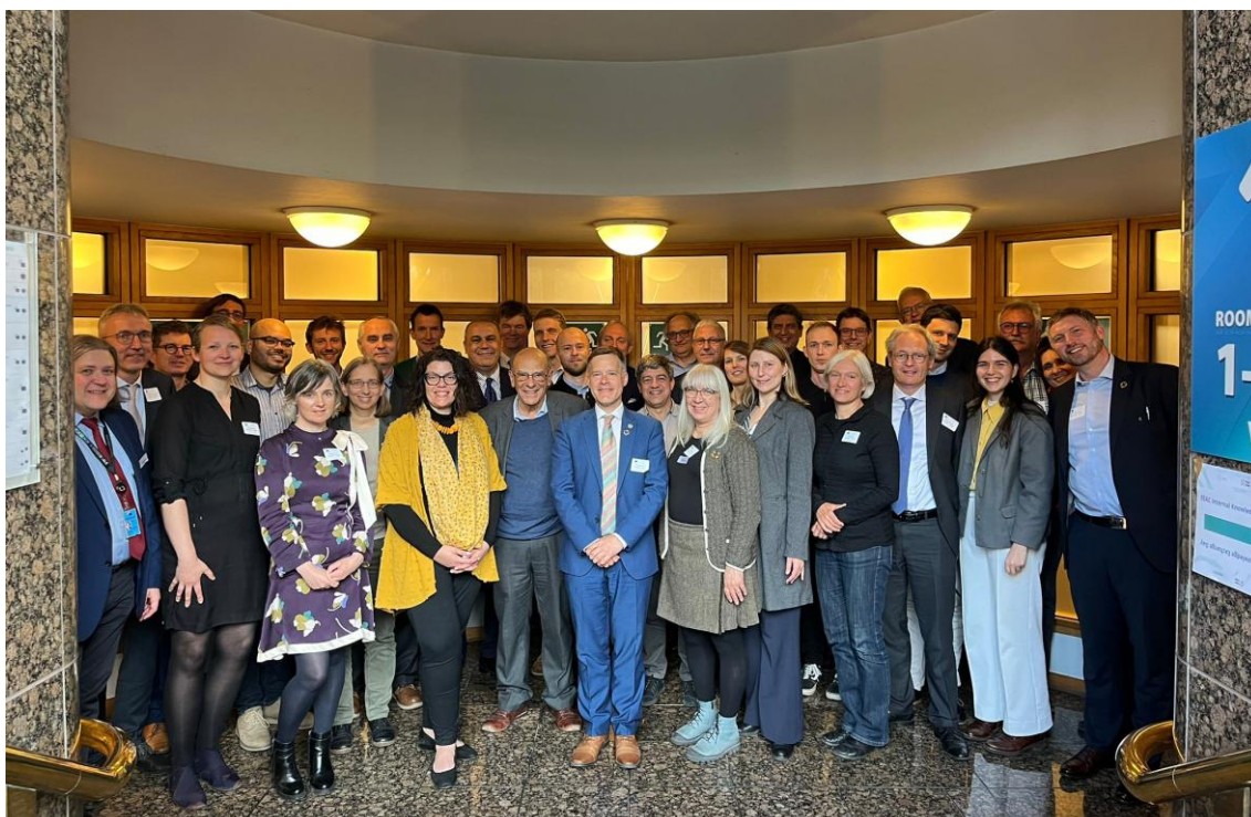
Fotografia de grupo dos participantes na 32.ª Conferência Anual da EEAC, Bruxelas.

Esta conferência apresentou a seguinte estrutura: